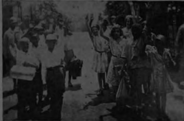
Niños sanos que tienen antecedentes de tuberculosis, de los barrios congestionados de la ciudad de Chicago, que llegan al Sanatorio, a disfrutar de una temporada de reposo, y de higiene. Presta así el Sanatorio, los beneficios de un preventivo

el sanatorio. En los archivos clínicos de esta institución, vi las historias de muchos pacientes costarricenses. Fue este sanatorio uno de los preferidos por los enfermos pudientes de nuestro país, cuando salían en busca de tratamiento sanatorial. El sanatorio ha seguido a estos pacientes aun después de 20 años de haber estado en él. El funcionamiento de su sección estadística que se hace económicamente, con un personal reducido, es admirable y de su detallado y preciso registro para tratar de mejorarlos y adaptarlos según los medios, las oportunidades y las cir-